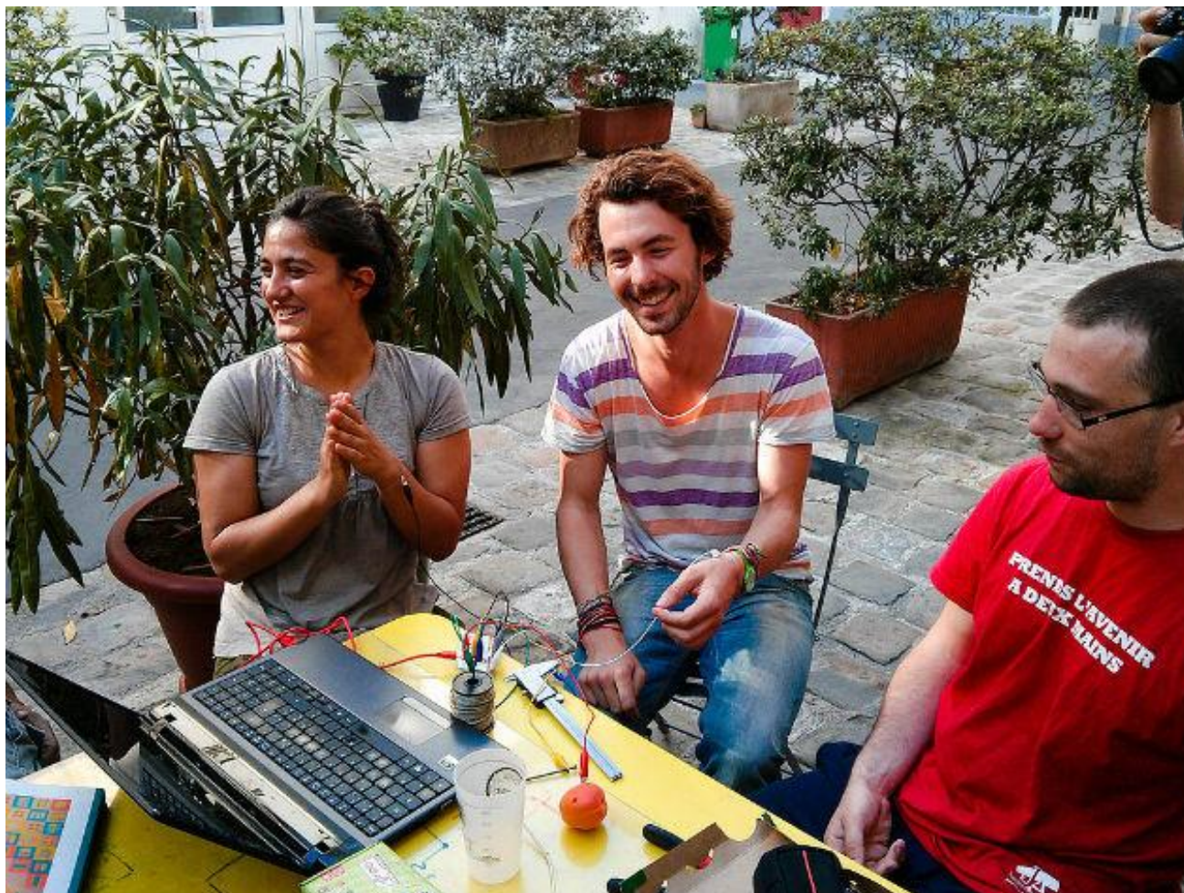
Le Petit FabLab de Paris,   Mitch Altman CC BY 2.0, via Wikimedia