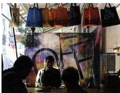
Au Village du Off

17H. Soirée Spedidam. Au collège de la Salle, sur invitation.