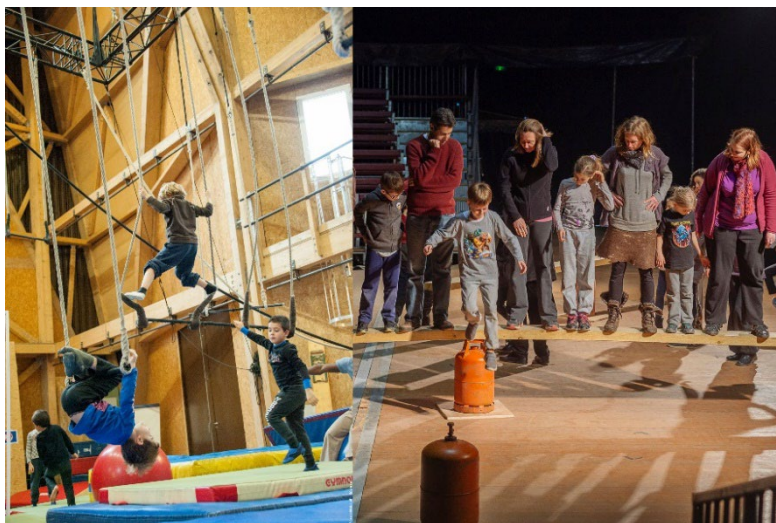
Stage PPCM - Stage Cirque Esquif