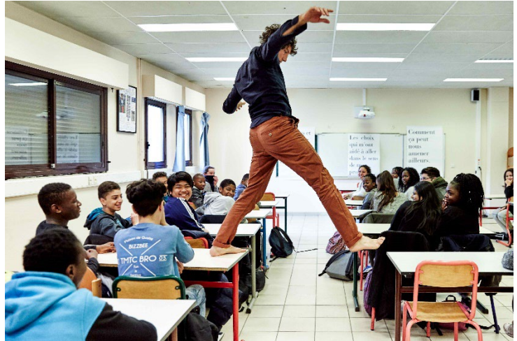
Mille-feuille, Jean-Baptiste André